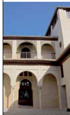
Palacio Dar al-Horra