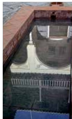
Casa Morisca de la Calle Horno de Oro