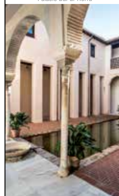
Casa de Zafra