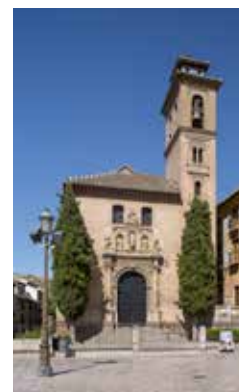
Iglesia de Santa Ana