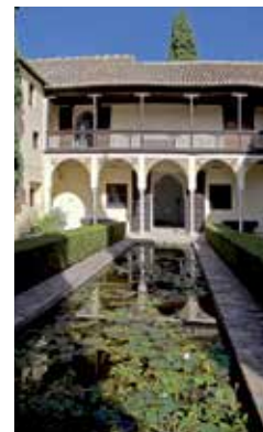
Casa del Chapíz