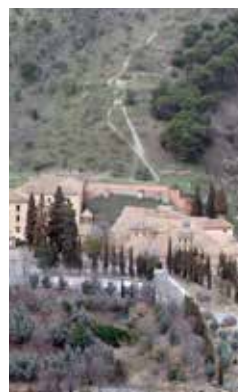
Abadía del Sacromonte